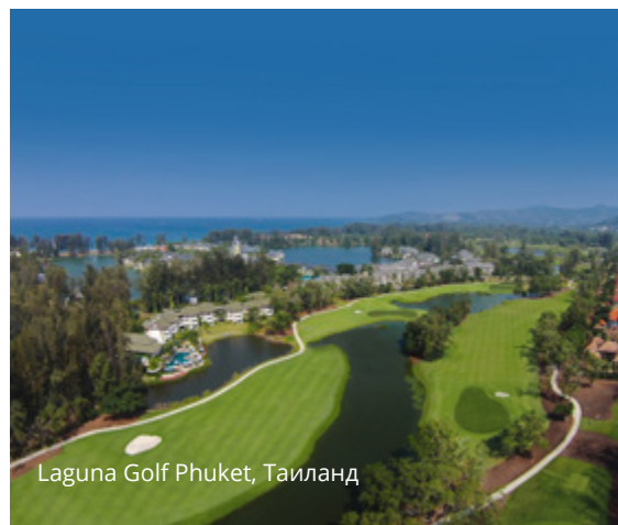
Laguna Golf Phuket, Таиланд