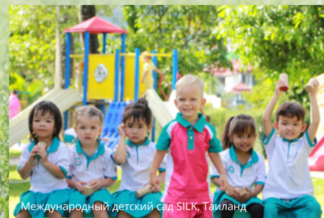
Международный детский сад SILK, Таиланд