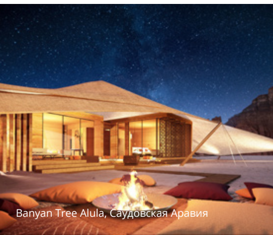
Banyan Tree Alula, Саудовская Аравия