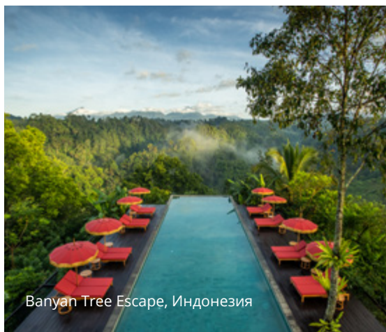
Banyan Tree Escape, Индонезия